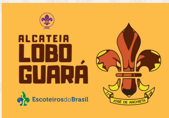
ALCATEIA LOBO GUARÁ